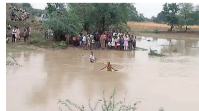
बच्चे का पता नहीं चला है। घटना पंडरापाठ चौकी क्षेत्र के भंडिया गांव का है।

जशपुर। जशपुर जिले में एक महिला अपने 2 बच्चों के साथ एक नाले में बह गई। बारिश की वजह से नाले का जल स्तर बढ़ा हुआ था। इसका वह अंदाजा नहीं लगा पाई। शाम को बाजार से लौटते वक यह हादसा हुआ है। महिला एक बच्चे को साड़ी से पीट पर बांधी थी और दूसरे को हाथ में लेकर साथ चल रही थी। कुछ लोगों ने उन्हें देखा, लेकिन उसे बचा नहीं पाए। एक बच्चे का शव एक किमी दूर मिला है। घटना की सूचना पुलिस को दी गई। रेस्क्यू टीम भी बुलाया गया, लेकिन अंधेरा होने की वजह से महिला साय और