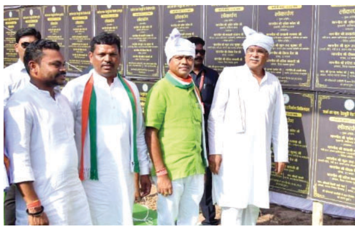
खुशहाली और सुख-समृद्धि की कामना की। मुख्यमंत्री ने इस मंदिर परिसर में आयोजित कार्यक्रम में सुकमा जिले की 100 देवगुड़ियां समर्पित की। आदिवासियों के आस्था के केन्द्र इन देवगुड़ियों का जीर्णोद्धार एवं सौंदर्यीकरण का कार्य मुख्यमंत्री श्री भूपेश बघेल की घोषणा के परिपालन में छत्तीसगढ़ शासन द्वारा अभी हाल ही में 5 करोड़ रुपए की लागत से कराया गया है।

रायपुर। मुख्यमंत्री भूपेश बघेल आज भेंट-मुलाकात कार्यक्रम अभियान के तहत सुकमा जिले छिंदगढ़ पहुंचे। मुख्यमंत्री भूपेश बघेल ने यहां मुसरिया माता का दर्शन एवं विधि-विधान से पूजा-अर्चना कर प्रदेशवासियों की