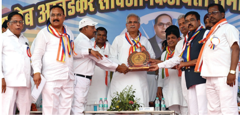
बाबजूद भी उच्च शिक्षा प्राप्त की और समाज की 'शिक्षित बनो, संगठित रहो और संघर्ष करो'। शिक्षा ही हमें अपने अधिकारों और कर्तव्यों का भान कराती है। जब हमें अपने कर्तव्य का भान

सभा को संबोधित करते हुए मुख्यमंत्री ने कहा कि बाबा साहेब अंबेडकर ने दलित, शोषित और वंचितों के लिए अपना संपूर्ण जीवन समर्पित कर दिया। वे जन्म से लेकर मृत्युपर्यंत दलितों के उद्धार में लगे रहे। उन्होंने सामाजिक दश झेलने के